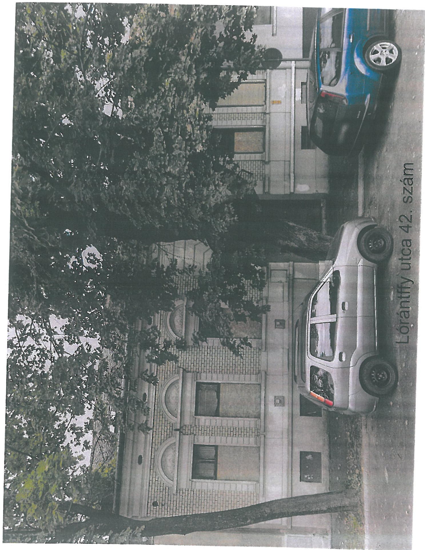
Lórántffy utca 42. szám