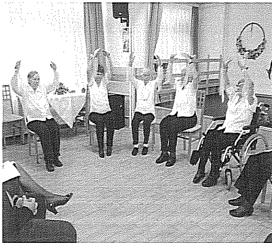
Idősek Napja a Pallagi úti intézményben