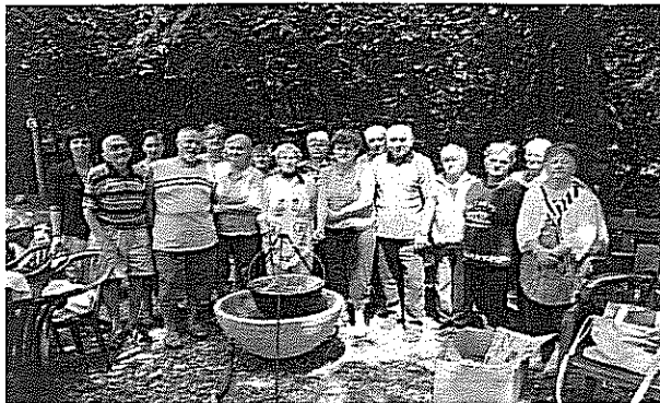
Főzőverseny a Pallagi úton