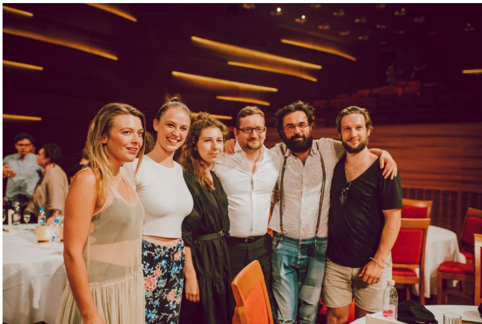
Pécsi Országos Színházi Találkozó

A 2018/2019-es évad értékelésekor elmondható, hogy a Csokonai Színház Európai évadja rendkívül sokszínű volt, amely sikerrel mutatta be az európai drámairodalom fontos alkotásait. Fiatal, energikus rendezők kezében új fénytörésben mutatkoztak be a nagy színházi klasszikusok, míg a jelentős rutinnal rendelkező, elismert szakemberek új darabokkal gazdagították a Csokonai Színház repertoárját.