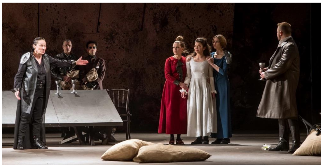
William Shakespeare: Lear

Ebben a hónapban került sor Sarah Kane ikonikus művének, a Szétbombázva című darabnak a stúdiószínházi bemutatójára. A produkció széles körű szakmai elismerést aratott, és bizonyította, hogy Debrecen közönsége érzékenyen és éretten fogadja a nehezebben befogadható színházi témákat is.