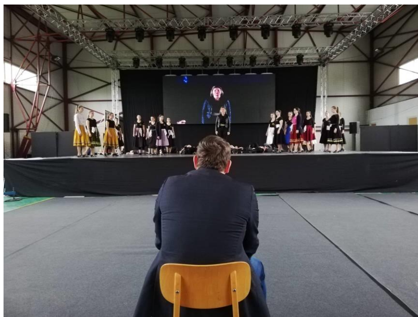
A Bánk bán szatmárnémeti próbája