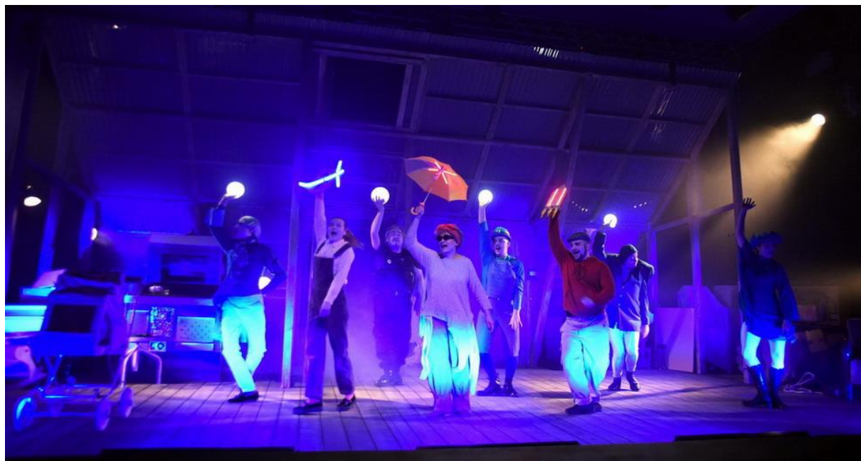
Presser-Sztevanovity-Horváth: A padlás