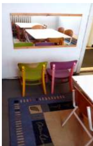
Fejlesztő szobánk logopédiai területe

Az öt év során többször történt a logopédusok személyében változás , pályaelhagyás miatt és a szakszolgálatnak is gondot okozott a szakemberek pótlása. Sokszor hónapokig voltak ellátatlanok a fejlesztésre szoruló gyermekek. A szülők arra kényszerültek, hogy magánúton vigyék el gyermekeiket logopédushoz.