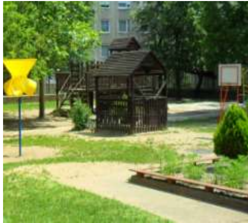
Udvarunk régen (2015)

lített ecetfa okozta csatornaelzáródás miatt a csatorna egy részét cseréltette ki a DIM.