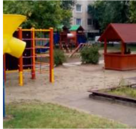
és most (2019).