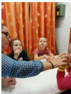
Logopédus hallgató záró tanítása 2019