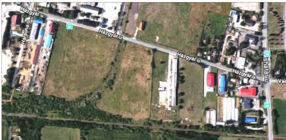
Légi felvétel a Házgyár utca déli - 17214/9-10 helyrajzi számú - területéről.