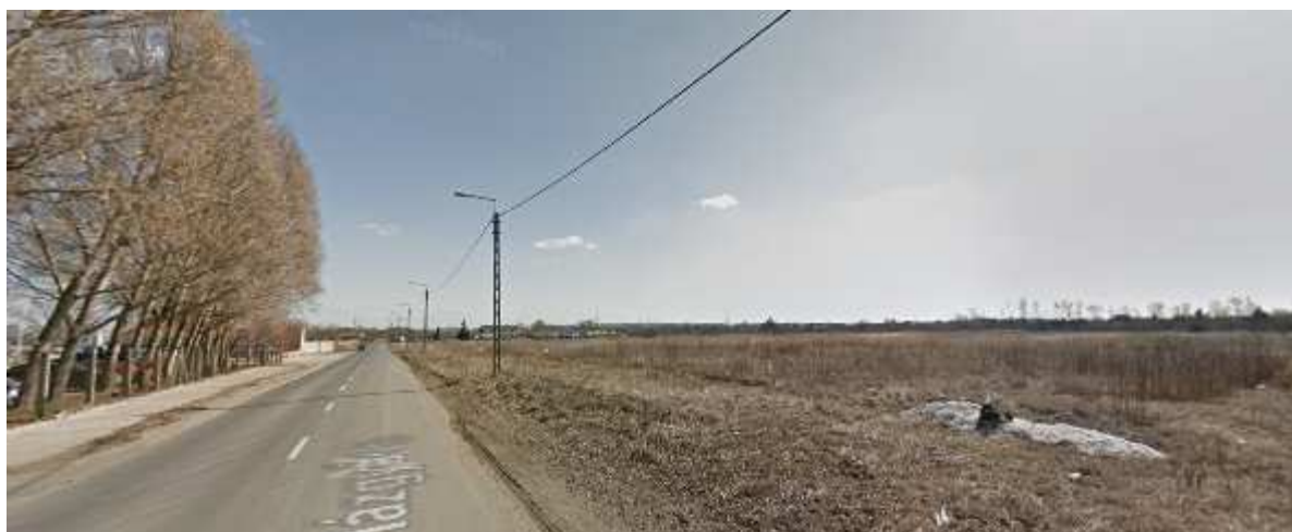
A Házgyár utca felől készült fotó felvétel nyugati irányból nézve

A jelenlegi üres terület beépítése mind utcaképi, mind településképi szempontból kedvező.