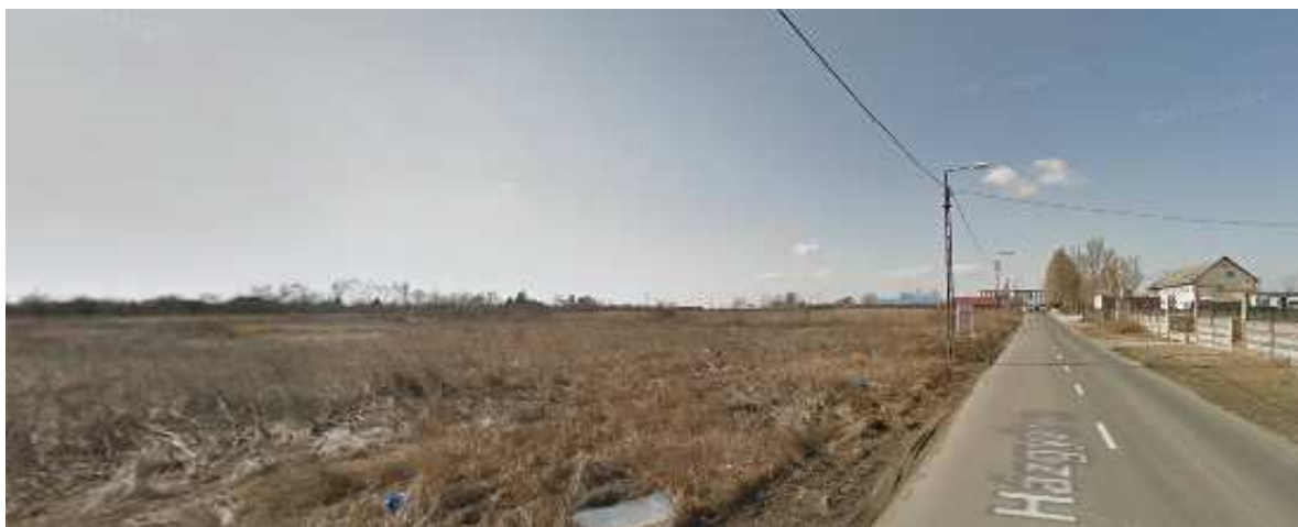
A Házgyár utca felől készült fotó felvételt keleti irányból nézve