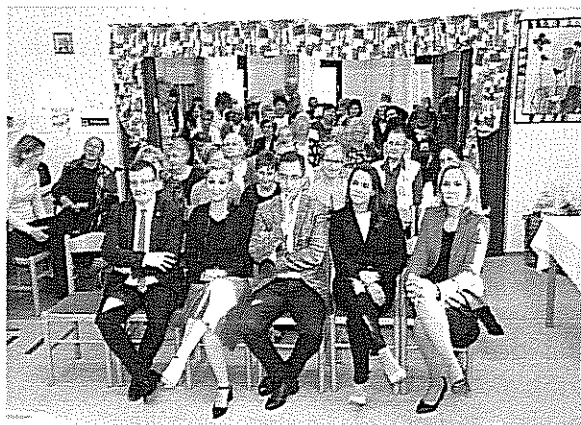
Idősek napja a Süveg utcai klubban