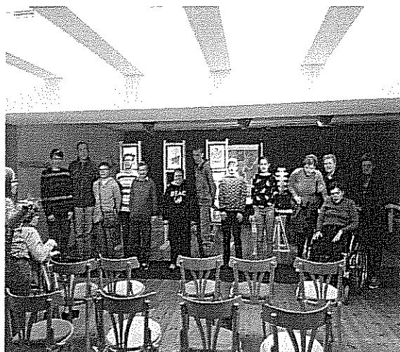
Mester utcai fiatalok bábszínházban