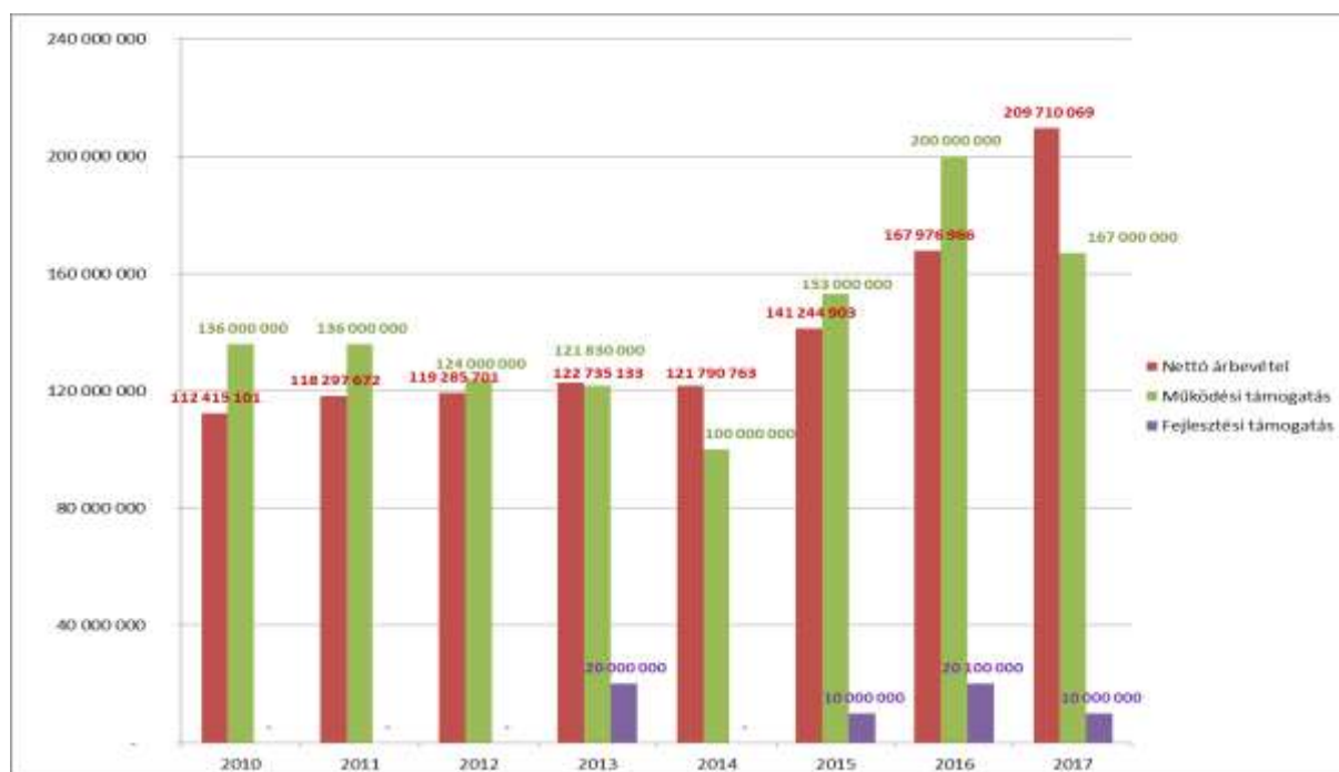
A Nagyerdei Kultúrpark Támogatás – Árbevétel grafikonja 2010 -2017

2018-ban az üzemserű működés biztosításához a tervezett működési célú támogatás 185 MFt, mely a bérek, anyagköltségek, igénybevett szolgáltatások, a jogszabályi előírásoknak, valamint üzemserű működéshez szükséges elmaradhatatlan javítási, karbantartási feladatok ellátásához feltétlenül szükséges.