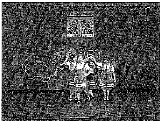
Még mindig aktívan