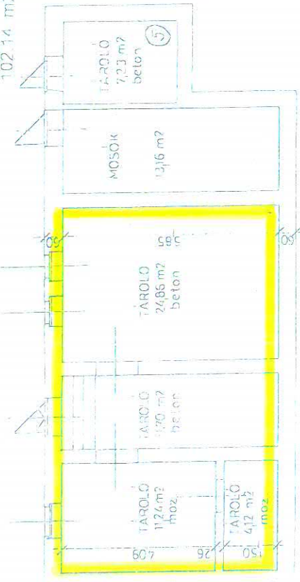
GARAY utca 18 Földszintü alaprajz