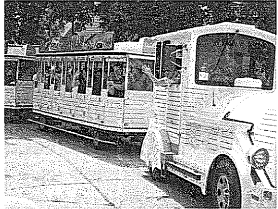
Gyereknapi a Böszörményi úton