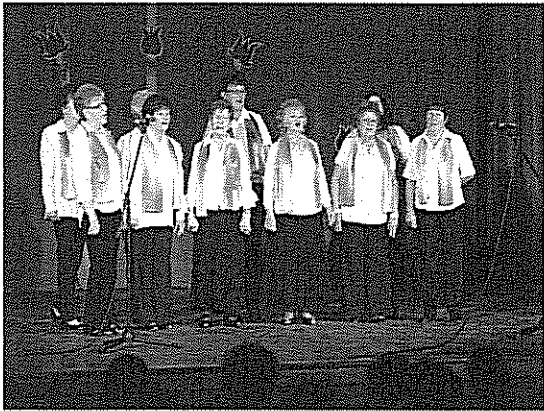
Még mindig aktívan