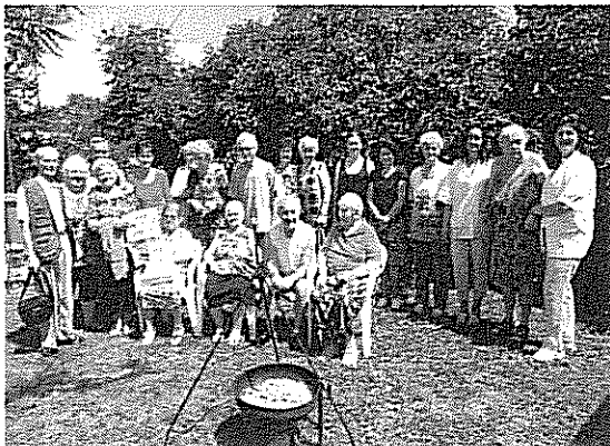
Kerti parti Pósa utcán