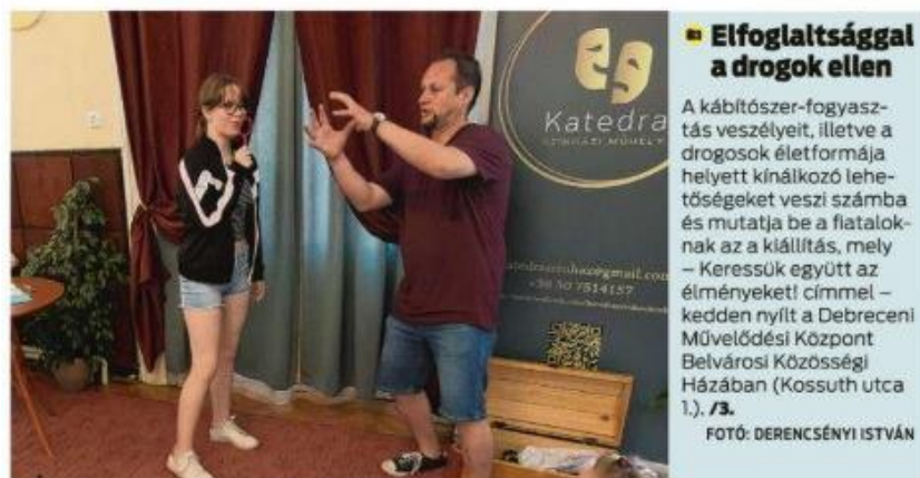
2018. június 13. Élményekkel szorítják háttérbe a függőséget